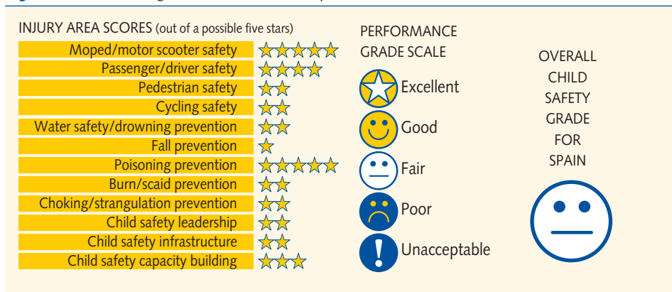
Figura 1. Informe de Seguridad Infantil 2009 (España).